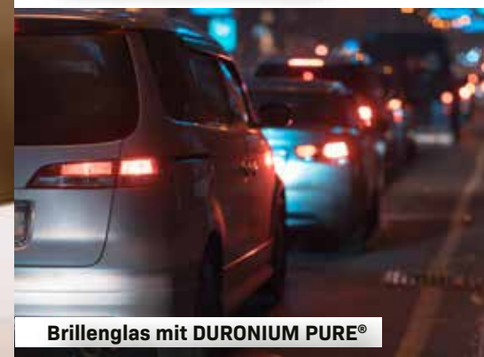
Brillenglas mit DURONIUM PURE®