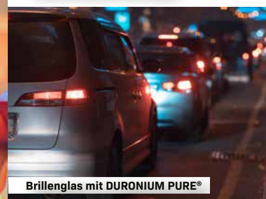
Brillenglas mit DURONIUM PURE®