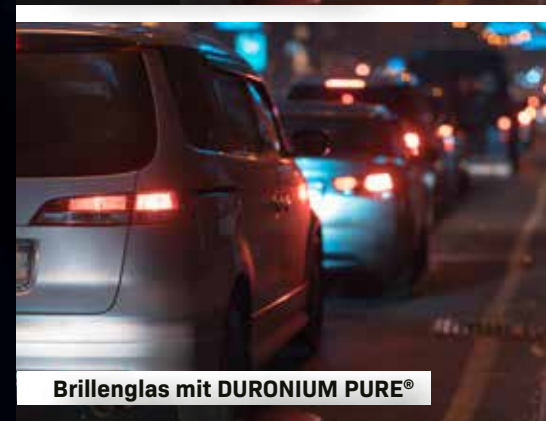
Brillenglas mit DURONIUM PURE®