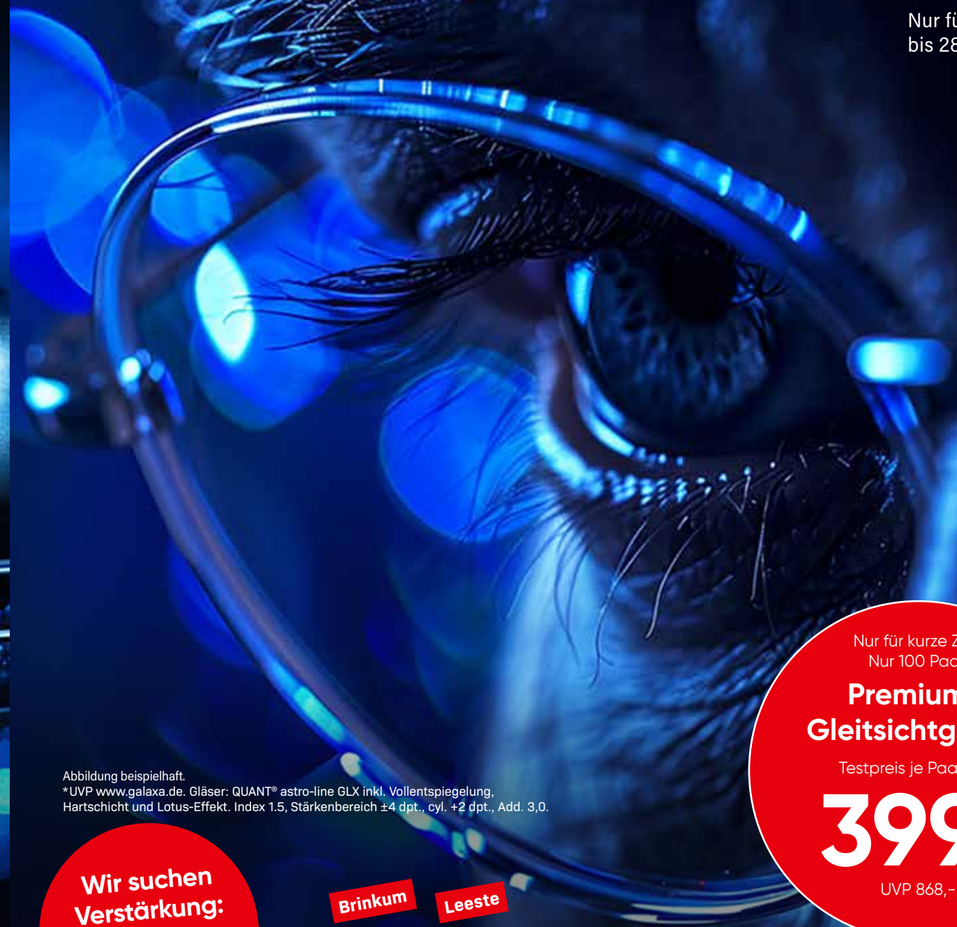
Abbildung beispielhaft. *UVP www.galaxa.de . Gläser: QUANT® astro-line GLX inkl. Vollentspiegelung, Hartschicht und Lotus-Effekt. Index 1,5, Stärkenbereich ±4 dpt., cyl. +2 dpt., Add. 3,0.